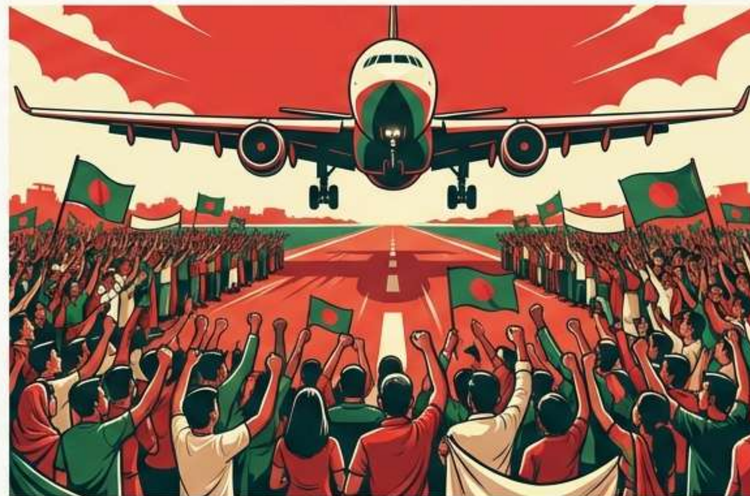
Accueil triomphal à Dacca.

Retour historique au Bangladesh. Fin de 17 années d'absence.